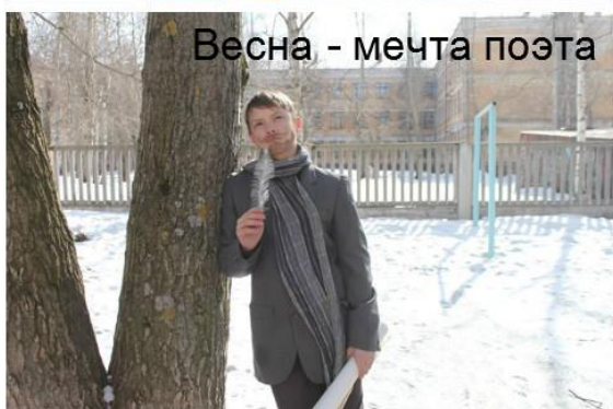
Весна - мечта поэта