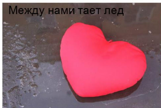
Между нами тает лед